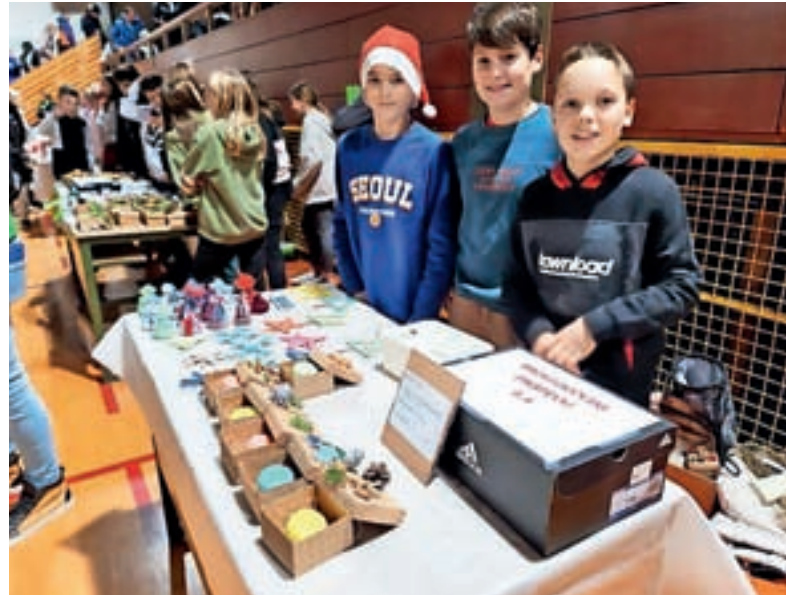
Miklavžev sejem v Osnovni šoli Žiri