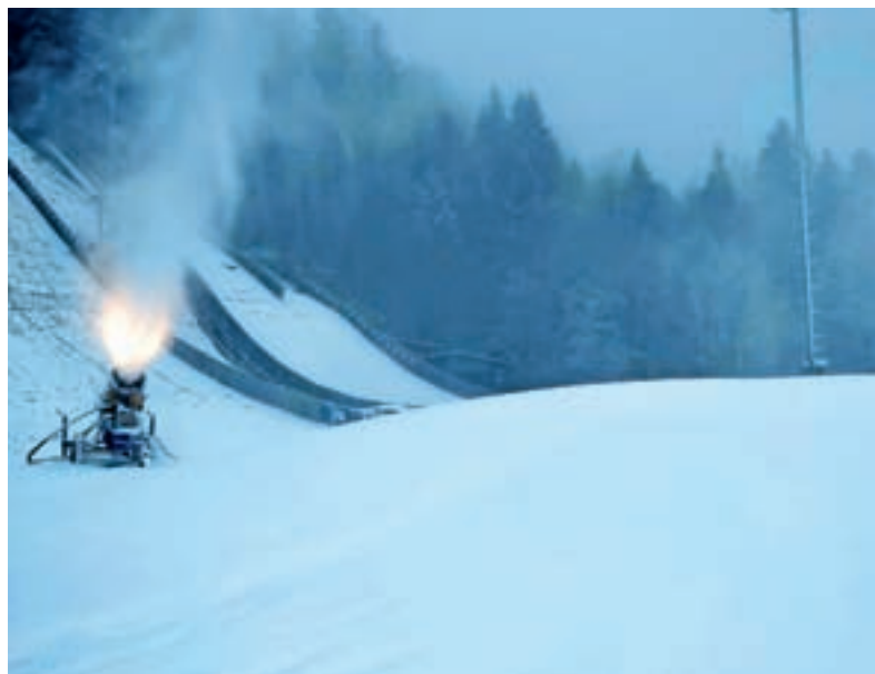
Decembra so že začeli zasneževati.

V Nordijskem centru Poclain skakalnice že pripravljamo za treninge na snegu, potem ko smo v mesecu novembru s pomočjo prostovoljcev izvedli vsa potrebna dela, da smo lahko mirno čakali na nižje temperature. Tik pred prvim snegom smo namestili še mreže za zadrževanje snega po doskočiščih in hladilni sistem na zaletiščih večjih dveh skakalnic. Prvi decembrski konec tedna, ki je prinesel tudi nižje temperature, pa smo že izkoristili za zasneževanje s snežnim topom. Tako upamo, da bodo naši športniki – zdaj imamo že kar 50 tekmovalcev – kmalu začeli