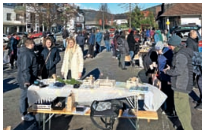
Adventni bazar Kluba žirovskih študentov

Kot vsako leto bomo tudi v prihodnjem letu v poletnem času organizirali Vikend športa in zabave. Naš najbolje obiskani dogodek bo potekal 6. in 7. julija. Odprli ga bomo s petkovima turnirjema v ulični košarki in nogometu, poleg tega pa tako igralce kot gledalce vabimo na met trojk in met s sredine. V soboto bo na vrsti turnir v odbojki, ki ga bodo popestrili pancerbalo, pir pong in prstomet, zvečer pa se bomo pozabavali ob odlični živi glasbi slovenskih skupin. Vabljeni vse generacije, da zažirate z nami.