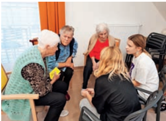
To jesen so začeli tudi z družabnimi srečanji z mladimi prostovoljkami iz Osnovne šole Žiri.

Vsem sodelujočim pri naših srečanjih se želimo iz srca zahvaliti. S svojo energijo, nastopom in dobro voljo prinesete svež veter in zagon v naš dom. Ne gre namreč samo za nastop, ampak za vse tisto vmes, kar se z besedami velikokrat ne da opisati. Hvala, ker soustvarjate žirovski dom starejših občanov skupaj z nami. Lepo je z občutkom povezanosti in sodelovanja vstopati v praznični čas, ki je pred nami.