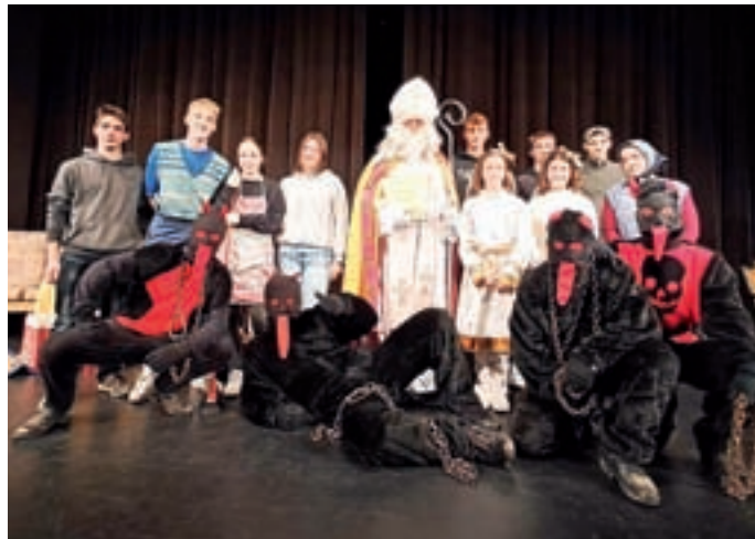
Miklavževanje v Žireh

Na predvečer obdarovanja se je oglasil v žirovski kinodvorani, kjer so vsem zbranim žirovski mladinci najprej predstavili kratko igrico Če ima sv. Miklavž zamudo, ki je želela nagovoriti s sporočilom, da delajmo dobro skozi vse leto, ne le zadnje dni pred Miklavževim prihodom. Dobrotnika so spremljali angelčki in parkeljni, slednji kot opomin za vse tisto, pri čemer se lahko izboljšamo. S seboj je prinesel nebeško knjigo, v kateri so zapisana vsa dobra in srčna dela, kot tudi tisto, kar ni bilo lepo in vredno pohvale. Ker pa je (bil) prepričan, da so otroci v Žireh veliko dobrega naredili, jim je po domovih pustil darove. Da je bilo lažje počakati, je tudi v kinodvorani za vsakega otroka posebej pustil knjižice, kruhove parkeljne, za katere so poskrbeli žirovski skavti, in nekaj sladkarij. Pokazal je navdušenje nad tem, da ima tudi v Žireh toliko pomočnikov in podpornikov: Župnijo Žiri, Občino Žiri, nekatera podjetja in seveda vsakega izmed nas, ki drug drugemu