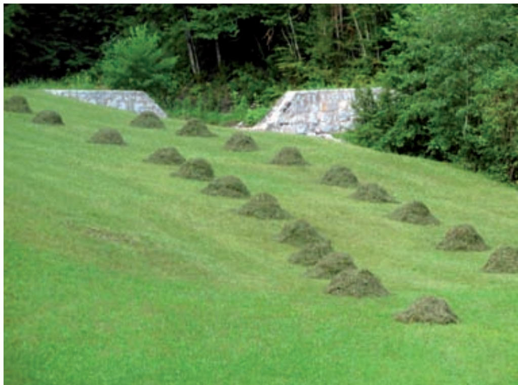
Dajati v kupe