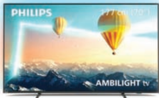
TV PHILIPS 70PUS8007/12 Diagonala 178 cm, neverjetna cena!