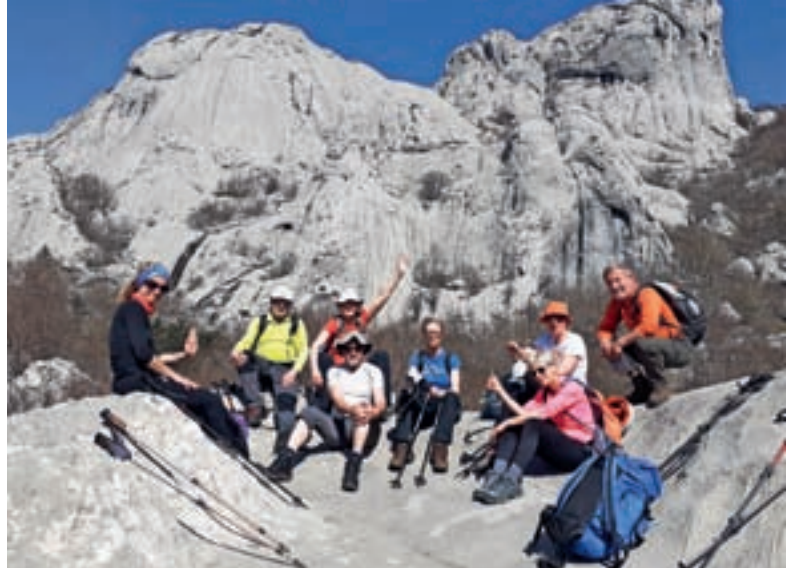
Planinski izlet v Paklenico

tojno planinarjenje v poznejših starostnih obdobjih. Velik poudarek je na krepitvi vrednot, kot so: prijaznost, poštenost, delavnost, odgovornost, vztrajnost, strpnost. Uresničitev naštetih ciljev pa izvajajo na vsakoletnih izletih v bližnji in daljni okolici. Za konec naj povzamemo besede Pinterja (1994), ki pravi: »Najdlje in najbolj varno bomo hodili v gore, če nam bodo le-te postale način življenja. Zato je treba človeka vzgojiti. Gore za vse življenje, to je cilj seveda za tiste, ki jih to zanima. Dosežemo ga lahko samo preko vseh stopenj vzgoje.«