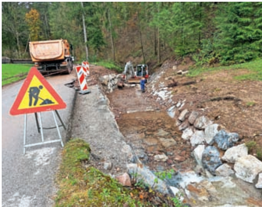
Ureditev struge v Jarčji Dolini