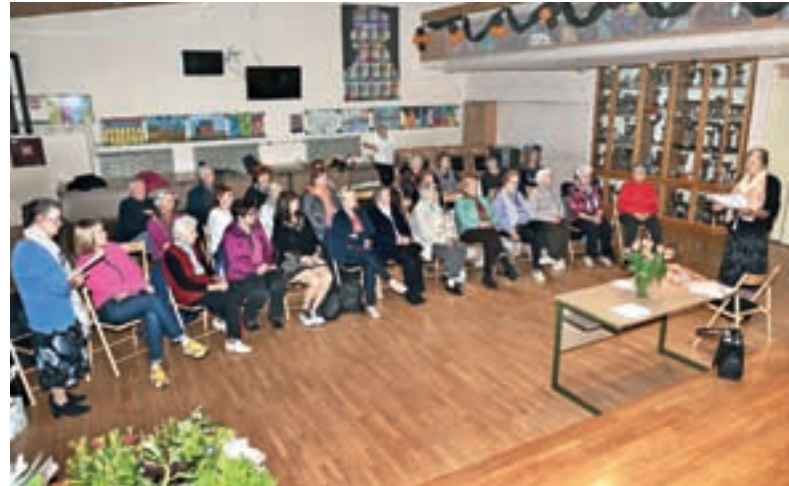
Skupina Cvetje v jeseni je zaznamovala dvajsetletnico delovanja.