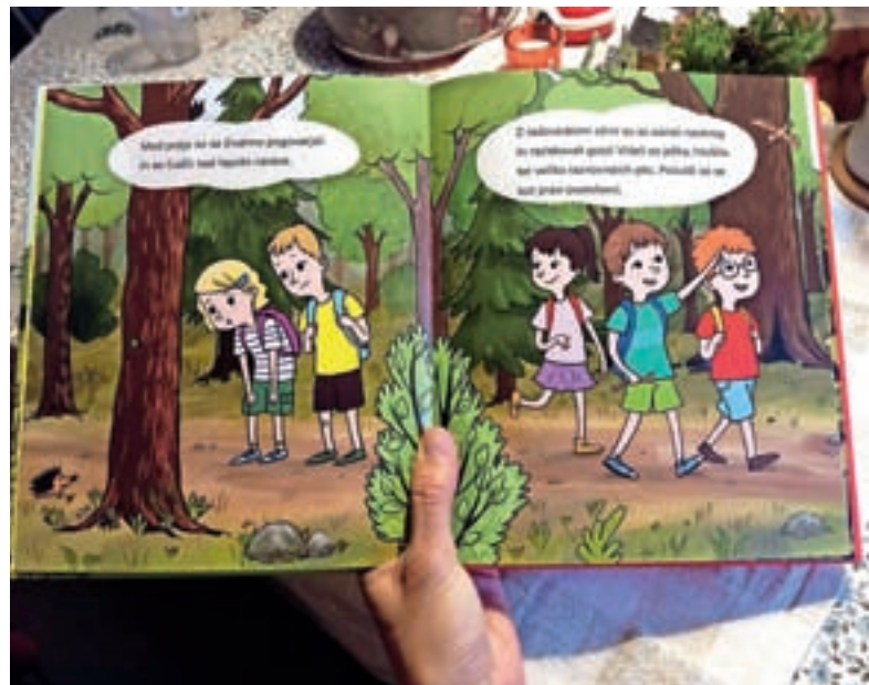
Mladi gasilci raziskujejo gozd in pogasijo tleči ogenj.

Požar na gozdni jasi je prva v nizu pripovedi o mladih gasilcih. »Moje ustvarjanje je trenutno usmerjeno v serijo petih knjig o prijateljih, ki so se spoznali na gasilskih vajah in skupaj raziskujejo svet. Bralec ob prebiranju zgodb izve, kaj je abak in za kaj je upo-