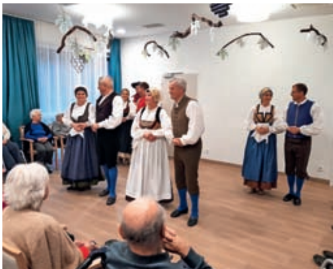
Martinovanje v domu je popestrila folklorna skupina Zala iz Turističnega društva Žirovski vrh.

V novembru seveda ne gre brez martinovanja, ki smo ga organizirali tudi v našem domu. Krstili smo mošt in uživali ob plesu folklorne skupine Zala iz Turističnega društva Žirovski vrh in petju Polanskih deklet. Tudi tokrat ni manjkala harmonika, veseli obrazi, dobra volja in druženje s prijatelji in znanci iz domače in sosednje občine Gorenja vas - Poljane.