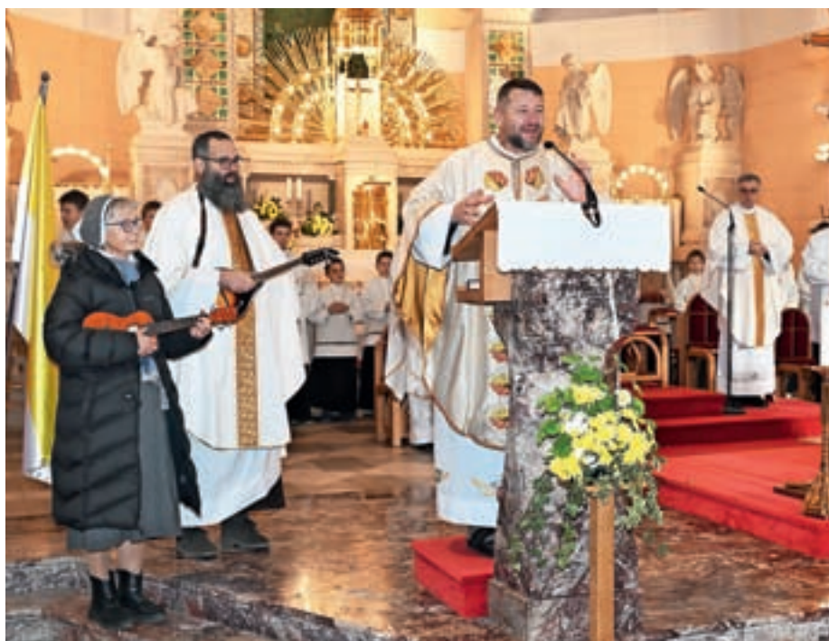
Obnovo misijona sta vodila brata kapucina, pridružila se jima je sestra frančiškanka – Marijina misijonarka.

Podobno kot lani se je tudi med obnovo misijona zvrstilo blizu dvajset dogodkov, kot so jutranji sprehod, jutranje hvalnice,