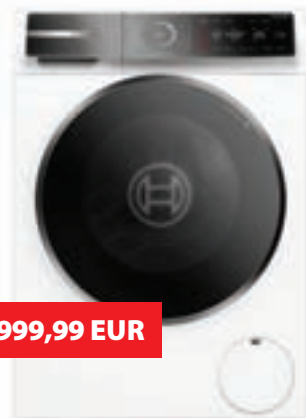
Pralni stroj BOSCH WGB24410BY – vrhunski model! 9 kg, 1400 obratov, inverter motor, para