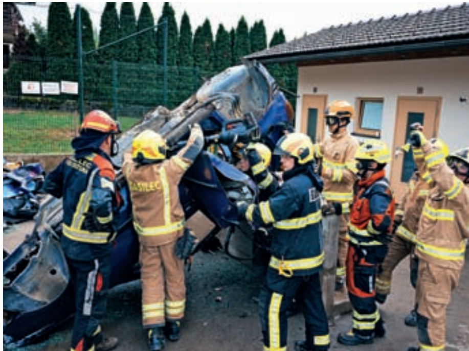
Dobračevski gasilci smo uspešno izvedli celodnevno izobraževanje Tehnično-reševalni dan Dobračeva.

škripčevja izvedli vertikalni dvig ponesrečenca na nosilih in reševalca. Poudarek točke je bil na izdelavi sistema škripčevja za čim lažji dvig ponesrečenca iz globine.