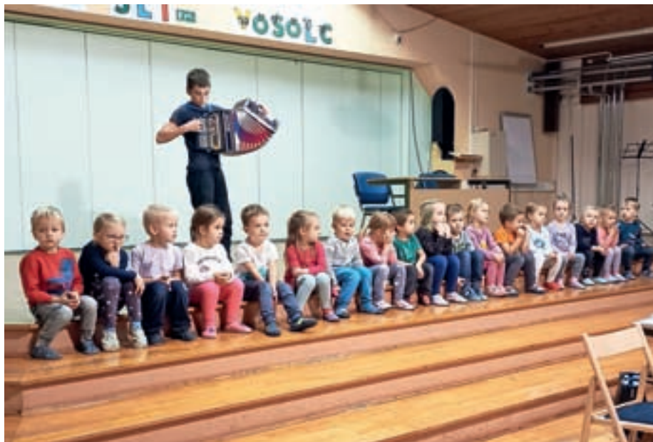
S prazničnim nastopom so razveselili tudi starejše.

Tudi ob koncu leta so v vrtcu krepili medgeneracijska prijateljstva – otroci so se z vzgojiteljicami ponovno zares potrudili in pripravili zanimiv program, s katerim so razveselili tako člane skupin starejših za samopomoč v šolskem večnamenskem prostoru kot stanovalce v Domu starejših SeneCura Žiri. Posebna dogodivščina pa je na zadnji novembrski dan čakala Skakalčke, ki so preživeli noč v vrtcu – razburljiva dogodivščina je vključevala pohod z lučkami, ogled risank na velikem platnu in spanje v vrtcu, kjer so veseli in razigrani uživali še ves naslednji dan. Uživali pa so tudi Muzikalčki, Navihančki in Ustvarjalčki, ki so starše povabili na druženje s pohodom na Ledinico in ogledom predstave Snežak, ki so jo vzgojiteljice uprizorile s senčnimi lutkami. Seveda pa to ni bila edina predstava, ki je zaznamovala konec leta. V lutkovnem abonmaju so si otroci ogledali Božično simfonijo, v jaslih so uživali v zgodbi Živali pri babici Zimi, sredi decembra pa so vzgojiteljice