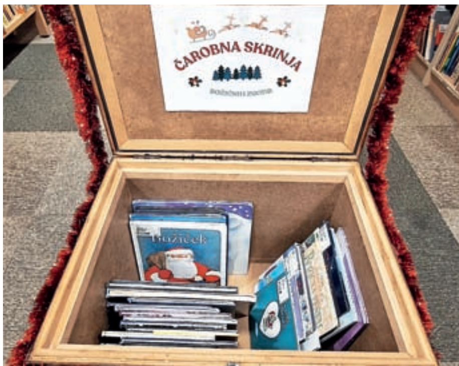
Čarobna skrinja, polna zimskih in božičnih zgodb

Spodbujamo vas tudi, da si na dolg decembrski večer vzamete čas, smuknete pod toplo odejo in si privoščite kakšno dobro knjigo. Če ste brez idej, si lahko pomagata z našim bralnim priporočilom.