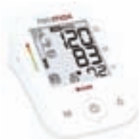
Vrhunski švicarski merilniki krvnega tlaka ROSSMAX