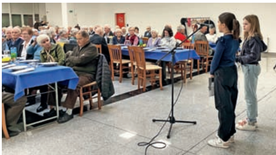
Srečanje so s programom popestrili učenci Osnovne šole Žiri.